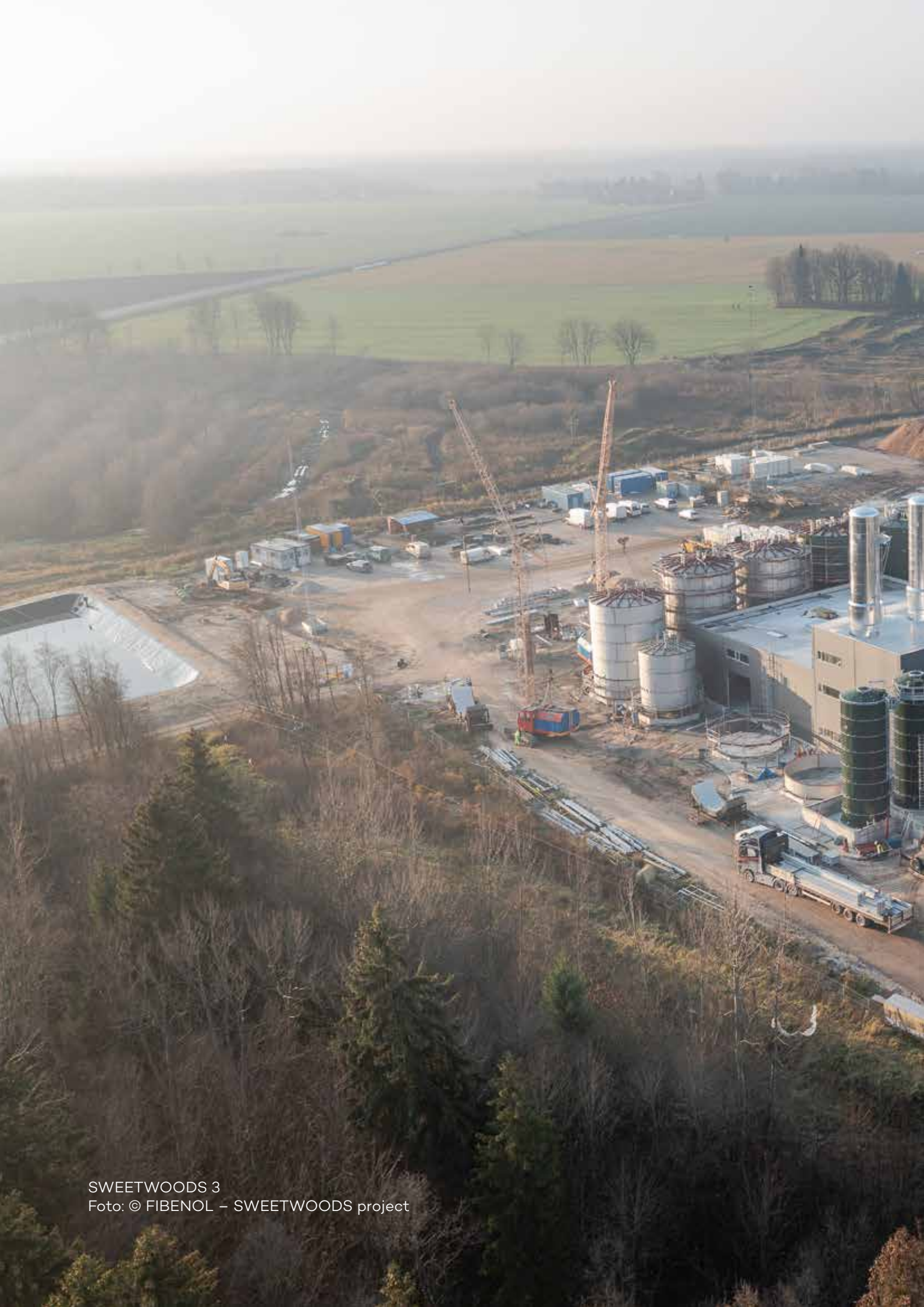
SWEETWOODS 3